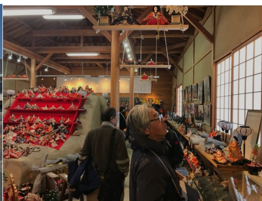
南あわじ市産業文化センター