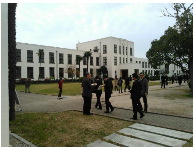
○旧豊郷小学校 見学風景